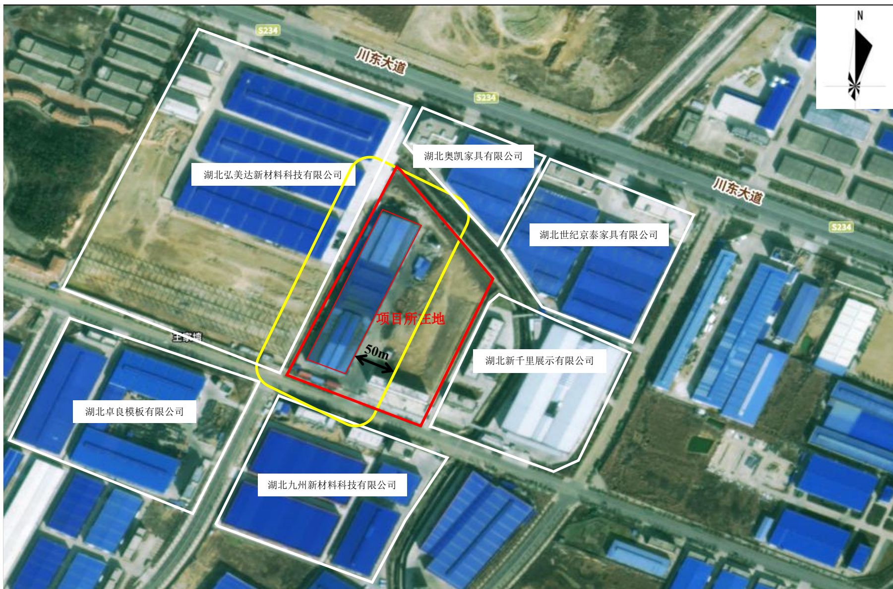
附图 6 项目卫生防护距离包络线图